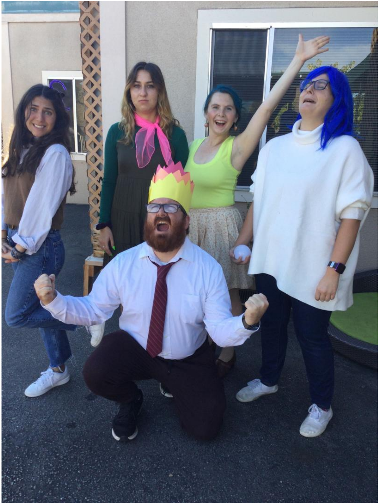
Our Halloween "Inside Out" staff group photo.